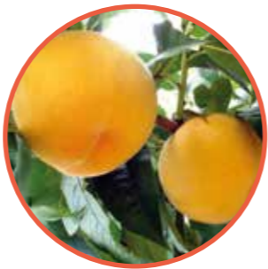
YELLOWSTONE® OBTENTOR | SMS Unlimited, California

Maduración: Época SUMMER RICH® • Árbol de buen vigor y porte semirígido tipo SUMMER RICH® • Muy buena productividad y fuerte floración de época precoz. • El fruto es redondo y grande, AA dominante, de un atractivo excepcional. • Color rojo oscuro luminoso. • Muy buena firmeza de evolución lenta. • Calidad gustativa muy buena, de tipo equilibrado. • Destacado: Variedad de melocotón con un potencial agronómico excepcional.