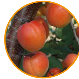
FARTOLI® OBTENTOR | BOIS France EDITOR | I.P.S.

Maduración: 5 días después de BERGERON® o FANTASME® Árbol de vigor medio y porte semiabierto, con ramificaciones cortas y largas, de muy buena productividad y fruto rápido. • Floración: época media y floribundidad buena. • Polinizador: Variedad autofértil. • Fruto de forma redonda/ovalada y calibre 2A/3A, con buena firmeza, con un 50% de "chapa" y color ruboreado rojizo y naranja fuerte. • Calidad gustativa muy buena, dulce y aromática. • Muy productiva y de bonita coloración. Reemplaza con ventaja a BERGAROUGE®.