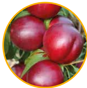
HONEY LATE® ZAI 827NJ OBTENTOR | ZAIGER GENETICS EDITOR | I.P.S.

Maduración: del 1 al 10 de agosto • Fecha de floración: media • Fruto ovalado con sabor subácido dulce y color rojo intenso. • De dureza firme y de intervalo calibre dominante AA-AAA. • Destacado: Nectarina distinguida por época, maduración, calibre, color, sabor y larga permanencia en el árbol. De pulpa muy firme de color amarillo.