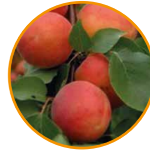
FARLIS® OBTENTOR | M.F. Bois EDITOR | I.P.S.

Maduración: 25 días después de BERGERON® • Árbol de vigor medio-fuerte y porte semirígido, con ramificaciones cortas, de buena productividad y fruto rápido. • Floración: época media (época FARBALY®) y floribundidad media-fuerte. • Polinizador: Variedad autofértil. • Fruto de forma ovalada y calibre 2A/3A, con firmeza media, con un 25-30% de "chapa", color con rubor anaranjado. • Calidad gustativa perfumada y dulce. • Completa la gama tardía autofértil de Carmingo®, con un nivel agronómico muy elevado.