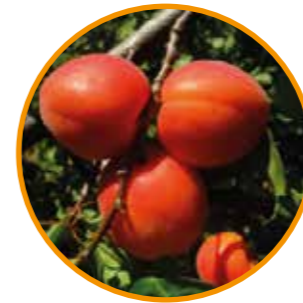
MEDOLY® OBTENTOR | M.F. Bois EDITOR | I.P.S.

Maduración: 10 días después de PRIMAYA® o 12-13 después de ALMABAR® Árbol de bajo vigor y porte semirígido, con ramificaciones cortas y largas y de muy buena productividad y fruto muy rápido. • Floración: 5 días después de FARBALY® y de floribundidad muy fuerte. • Polinizador: Variedad autofértil. • Fruto de forma elíptica y calibre 2A, con firmeza de media a buena, de un color rojo brillante sobre la totalidad de la piel. • Calidad gustativa muy buena y muy aromática.