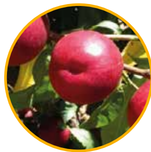
SILVER BRIGHT® ZAI 770NB OBTENTOR | ZAIGER GENETICS EDITOR | I.P.S.

Maduración: 2 días antes que ROYALE QUEEN® Zaisirly • Árbol de vigor medio, porte vertical, muy productivo en el corte de ramas mixtas. • Floración moderadamente abundante, de época precoz. • El fruto de calibre dominante AA, posee una muy buena firmeza. • Coloración rojo fuerte muy luminoso en toda la piel. • Buena calidad gustativa con un equilibrado perfume. • Variedad excepcional por su gran calibre y presentación.