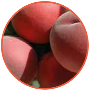
SWEET HENRY® OBTENTOR | ZAIGER GENETICS EDITOR | I.P.S.

Maduración: Precoz, 15-20 días antes que ROMEA • Árbol de porte semierecto y vigor medio-alto • Entrada precoz en producción y de productividad elevada • Buen cuajado • Fruto de forma oblonga, de buena dureza y calidad gustativa muy buena. • Calibre de 75-80g • Muy buena conservación. • Destacado: Variedad de melocotón de carne dura precoz, con gran capacidad productiva, gran firmeza y sabor.