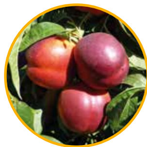
TARDERINA® C-54 OBTENTOR | Grupo ALM

Maduración: 4 días antes que ZEE GLO® • Árbol muy vigoroso, de porte vertical, muy productivo. • Floración en época normal, abundante. • Potencial de producción muy elevado. • El fruto es de gran calibre AA dominante, de coloración rojo oscuro. • La firmeza es tipo BIG TOP® de evolución lenta. • Calidad gustativa excepcional muy dulce y aromática, con un toque de acidez.