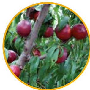
ALMANEB® C-1 OBTENTOR | Grupo ALM

Maduración: del 3 al 15 de junio • Fecha de floración: media • Fruto ligeramente ovalado con sabor dulce y color rojo intenso • De buena dureza y de intervalo calibre dominante B • Destacado: Nectarina de sabor dulce que aumenta hasta muy dulce en su maduración fisiológica. Variedad de aspecto muy atractivo por su color de la piel, de un rojo 100% y con pulpa amarilla.