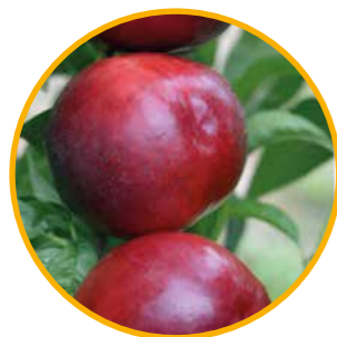
BIG WHITE® ZAI 877NB OBTENTOR | ZAIGER GENETICS EDITOR | I.P.S.

Maduración: 8-10 días después que RED FAIR® Zaifane • Árbol vigoroso, con porte semi-vertical, muy productivo, fructificando sobre todo tipo de rama. Floración abundante de época tardía. • El fruto, de una coloración rojo oscuro, consigue un calibre dominante de AA/A. La dureza y la calidad gustativa son muy buenas, con buenos azúcares solubles. • Destacado: Variedad tipo HONEY ZEE® con una coloración excepcional para la época.