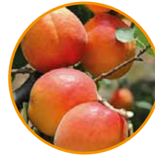
FARBALY® OBTENTOR | BOIS France EDITOR | I.P.S.

Maduración: 45 días después de BERGERON® Árbol vigoroso de porte semi-abierto, muy productivo. • Floración abundante, de 5 a 7 días antes que BERGERON®. • Variedad AUTOFÉRTIL. Fruto redondo, de una firmeza excepcional, calibre AA/AAA, de color naranja luminoso con un 30-40% de "chapa". Muy buen sabor dulce y equilibrado. AUTOFÉRTIL, rústica, de presentación excepcional. Adaptada a todas las regiones. Muy buena conservación de la fruta en el árbol.