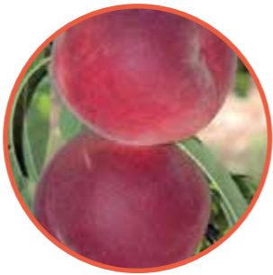
LUCIUS® ZAI666Pb OBTENTOR | ZAIGER GENETICS EDITOR | I.P.S.

Maduración: Época ANITA® • Árbol vigoroso, de porte semirígido y muy productivo. • Importante floración de época precoz. • El fruto es magnífico, con una forma esférica y muy colorido, de un rojo oscuro luminoso en la totalidad de la superficie. • Calibre dominante A/AA muy homogéneo. • La firmeza es remarcable por una precocidad sin puntos débiles. • Calidad gustativa excepcional de tipo equilibrado. • Destacado: PATTY® es, sin duda, una de las mejores variedades precoces del mercado, con un potencial de producción y calibre insuperable.