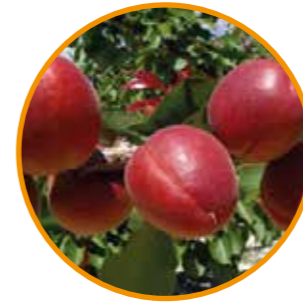
PRICIA® OBTENTOR | BOIS MF EDITOR | I.P.S.

Maduración: 30 días después de BERGERON® Árbol de vigor fuerte y porte semirígido, con ramificaciones cortas y largas, de muy buena productividad y fruto rápido. • Floración: floribundidad fuerte. • Polinizador: Variedad autofértil. • Fruto de forma elíptica y calibre 3A, con firmeza buena, con un 25-50% de "chapa" y un color rojo-anaranjado luminoso. • Calidad gustativa buena y equilibrada. • Variedad excepcional para el hueco de maduración que ocupa.