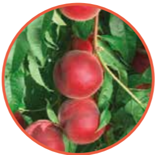
ROYAL SUMMER® OBTENTOR | ZAIGER GENETICS EDITOR | I.P.S.

Maduración: unos días antes que SPRINGCREST • Árbol de vigor medio para portainjertos vigorosos tipo CADAMAN® • Variedad muy productiva de floración precoz y fruto rápido. • Gran calibre en el fruto para la época (A largo dominante), de forma redonda y coloración rojo oscuro luminoso y atractivo. • Evolución de maduración lenta en el árbol y de buena calidad gustativa, dulce y azucarado. Destacado: La variedad de melocotón amarillo para iniciar la temporada.