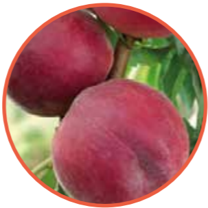
SUGARTIME® OBTENTOR | ZAIGER GENETICS EDITOR | I.P.S.

Maduración: unos días antes que SPRINGCREST • Árbol de vigor medio para portainjertos vigorosos tipo CADAMAN® • Variedad muy productiva de floración precoz y fruto rápido. • Gran calibre en el fruto para la época (A largo dominante), de forma redonda y coloración rojo oscuro luminoso y atractivo. • Evolución de maduración lenta en el árbol y de buena calidad gustativa, dulce y azucarado. Destacado: La variedad de melocotón amarillo para iniciar la temporada.