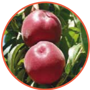
PATTY® OBTENTOR | ZAIGER GENETICS EDITOR | I.P.S.

Maduración: Época O'HENRY® Mercyl • Árbol de rápida entrada a producción, porte semi-decaído, muy productivo. • Floración muy abundante de época normal. • Calibre dominante AA, con un color rojo fuerte luminoso en la mayoría de la superficie del fruto. La calidad gustativa es muy buena, marcando mucho el azúcar. • Muy bonita variedad con fuerte coloración, que la hace un muy buen sustituto de ROYAL JIM®.