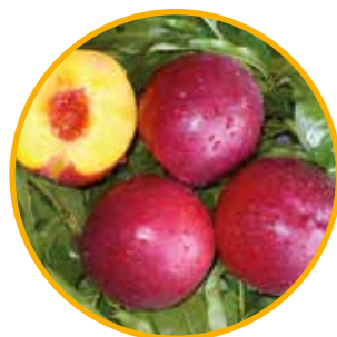
HONEY ROYALE® OBTENTOR | ZAIGER GENETICS EDITOR | I.P.S.

Maduración: del 3 al 15 de junio • Fecha de floración: media • Fruto ligeramente ovalado con sabor dulce y color rojo intenso • De buena dureza y de intervalo calibre dominante B • Destacado: Nectarina de sabor dulce que aumenta hasta muy dulce en su maduración fisiológica. Variedad de aspecto muy atractivo por su color de la piel, de un rojo 100% y con pulpa amarilla.