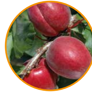
RUBISTA® OBTENTOR | M.F. Bois EDITOR | I.P.S.

Maduración: 10 días después de PRIMAYA® o 12-13 después de ALMABAR® Árbol de bajo vigor y porte semirígido, con ramificaciones cortas y largas y de muy buena productividad y fruto muy rápido. • Floración: 5 días después de FARBALY® y de floribundidad muy fuerte. • Polinizador: Variedad autofértil. • Fruto de forma elíptica y calibre 2A, con firmeza de media a buena, de un color rojo brillante sobre la totalidad de la piel. • Calidad gustativa muy buena y muy aromática.