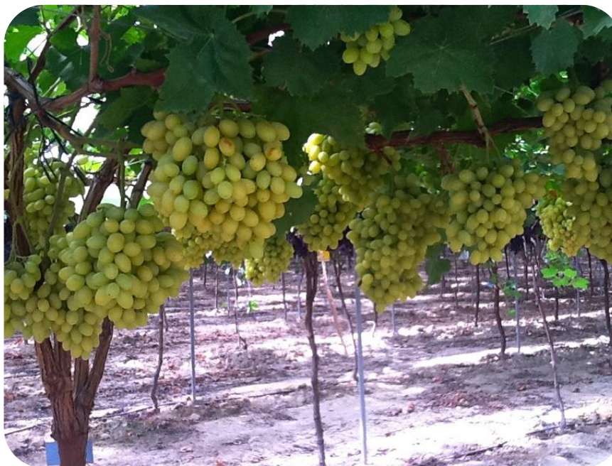
GA3 raleo 0,4 ppm, anillado, GA3 crecimiento 4 ppm. Despunte racimos largos