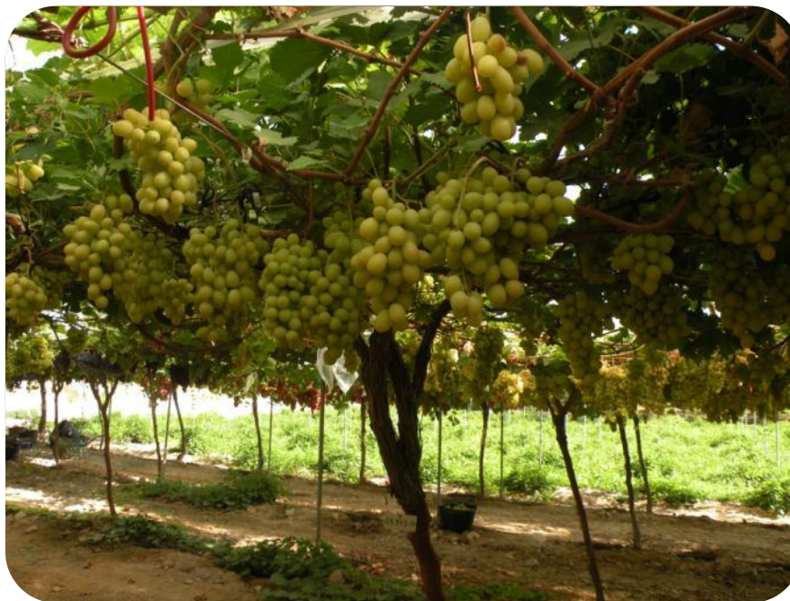
GA3 raleo 0,4 ppm, anillado GA3 crecimiento 7 ppm