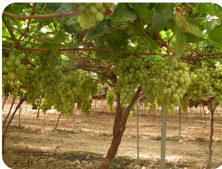
GA3 raleo 0,4 ppm, anillado GA3 crecimiento 4 ppm